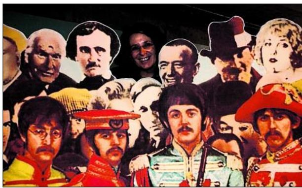
Das Cover der Beatles-LP „Sgt. Pepper's Lonely Hearts Club Band“ – ergänzt mit dem Konterfei einer Museumsbesucherin.

ersten Konzerten Verschnaufpausen verschaffte, denn die Band musste meist von 19 Uhr bis zum Morgengrauen spielen, angetrieben vom fiesigen Clubbesitzer Bruno Koschmider.“ Die Beatles-Expertin garniert diese Geschichte am Straßenrand mit einer fetzigen Strophe von „Rock-'n'-Roll-Music“ auf ihrer Ukulele und führt die Fan-Karawane weiter zum Kaiserkeller, der zweiten Beatles-Bühne. Gegenüber stand einst der Star Club, ein Marmorstein erinnert noch an ihn.